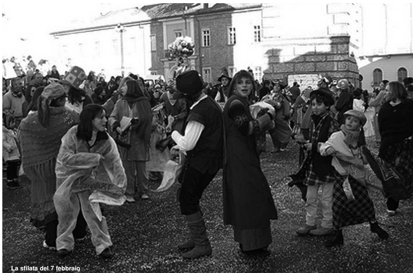
La sfilata del 7 febbraio