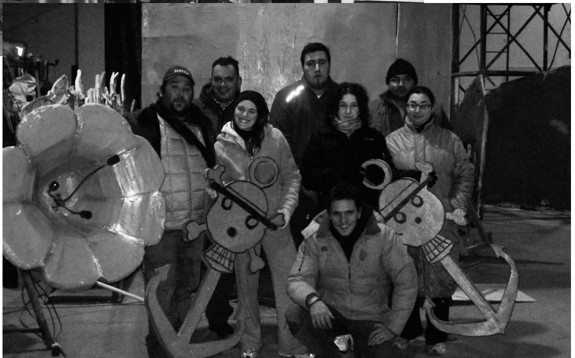
Il Gruppo giovani che ha costruito Suma a post cuma na barca n'tel bosc