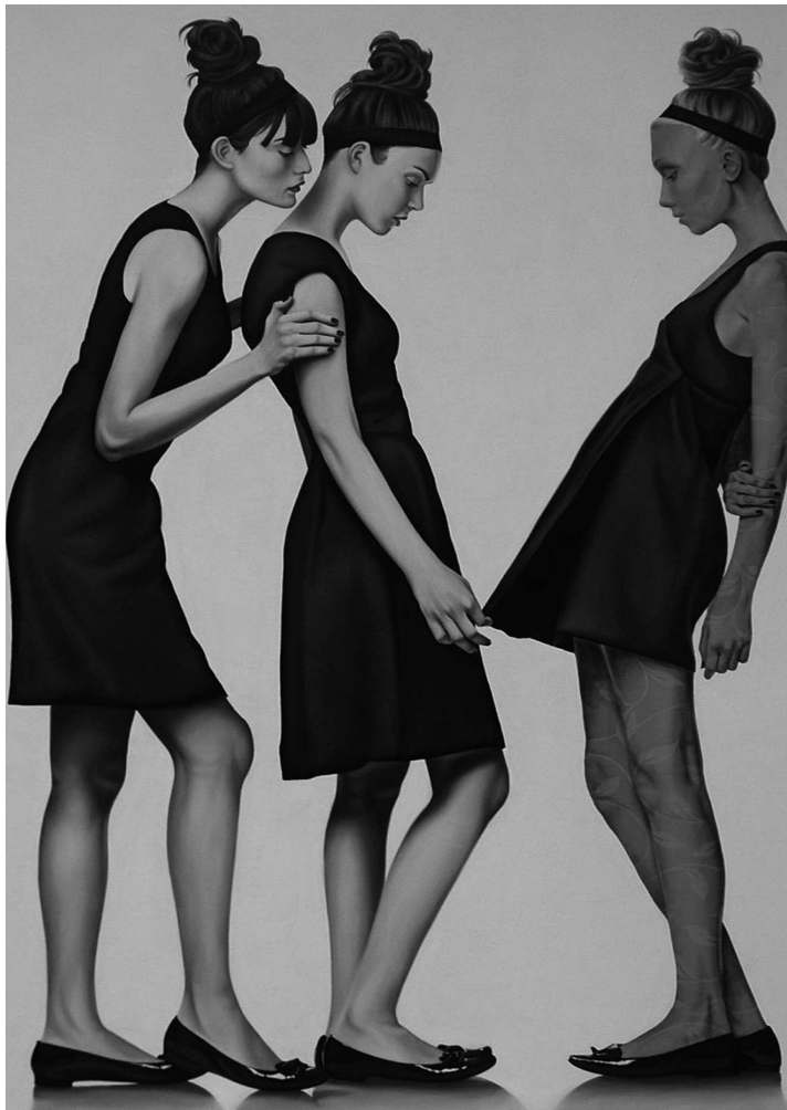
Galfione - Everything That Happens Will Happen Today, 2009, olio su tessuto a rilievo

La sua è una pittura “per sottrazione” che, grazie