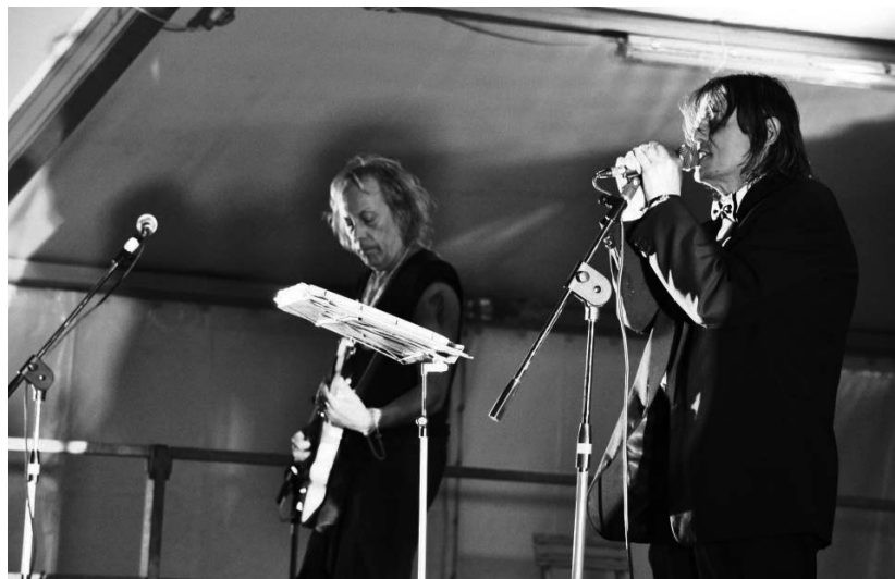
Freak Antoni Band al Deme'n'fest