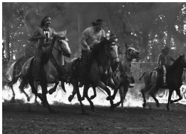
Horse spirit show

Ed ecco che, come ho già avuto occasione di dire all'inaugurazione della fiera, il lavoro dei volontari diventa quanto mai indispensabile per sostenere le iniziative in un contesto di crisi economica serio e duraturo; penso quindi che a loro vadano i meriti ed i ringraziamenti di tutta la collettività, così come alle aziende ed ai commercianti che hanno sostenuto l'iniziativa e che, visto il successo, ne hanno fortunatamente anche raccolto i frutti. Iniziative di questa portata non sono prive di effetti collaterali, soprattutto quelli connessi alle difficoltà nella