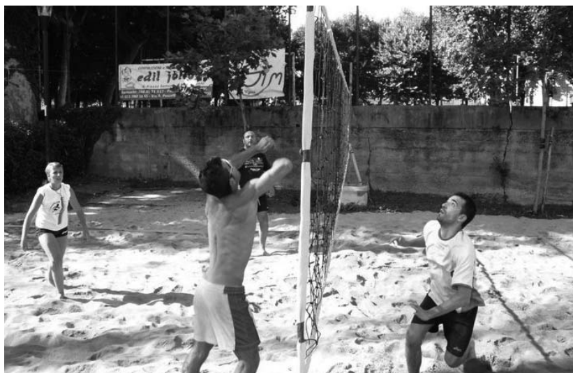
Partita di beach volley ai Viali

Grazie all'aiuto di diversi ragazzi e di Beppe e Pinuccia, sul campo in sabbia si sono giocate innumerevoli partite fino a fine agosto, a cui hanno partecipato anche ragazzi "diversamente giovani" nelle