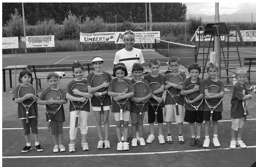
I piccoli tennisti del corso estivo

La giornata, nonostante il tempo minaccioso, è stata caratterizzata da una dimostrazione tennistica che ha coinvolto tutti i nostri giovani sportivi che, dopo il saggio, sono