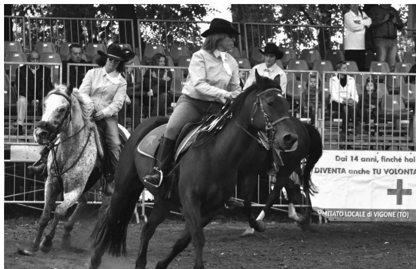
Carosello in rosa

Forestali per l'unicità del suo genere, ma soprattutto un'edizione che ha avuto un grande riscontro di pubblico, ben al di là delle migliori attese.