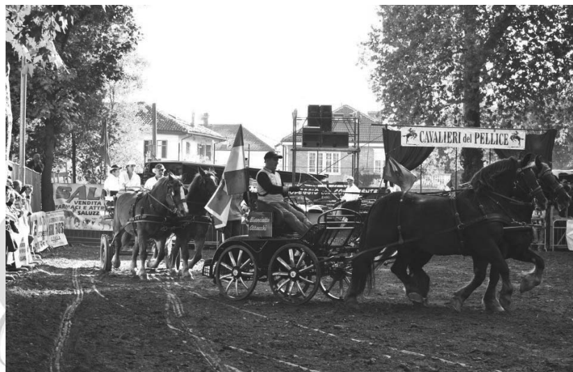
Carosello carrozze

mai attente a selezionare la qualità delle iniziative da supportare, soprattutto in un contesto economico molto critico come