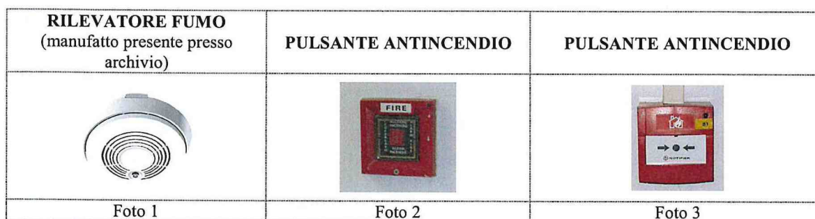
Foto 3: premendo con una semplice pressione del dito sul tondo nero indicato dalle due frecce vengono attivate le sirene di allarme antincendio e le misure di sfollamento dell'edificio.

Foto 2: rompendo il vetrino vengono attivate le sirene di allarme antincendio e le misure di sfollamento dell'edificio.